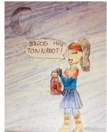
Rajzolta: Szepesi Panni

Élete egyik fő feladatának tekintette a kereszténység hirdetését, a pogányság megtérítését. 371-ben választották Mártont – minden