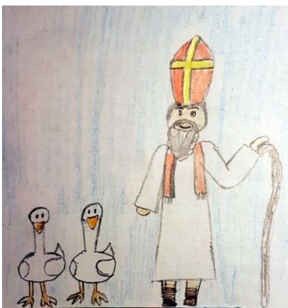
Rajzolta: Szepesi Panni

ellenkezése ellenére – Tours püspökévé. Ehhez kötődik egyik leghíresebb legendája: elrejtőzött libaólban, hogy az őt megválasztani kívánók ne találhassák meg, azonban a ludak gágnni kezdtek, így Mártont felfedezték, püspökké választották.